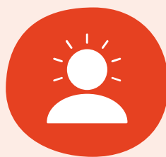
Medveten om egna och andras fördomar