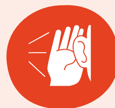
Nyfiken & inlyssnande